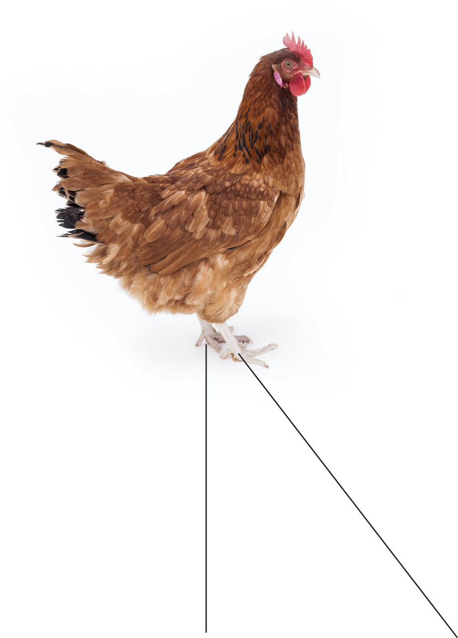
lalka do animacji wielkosci naturalnej +. Animowana za pomocą dwóch czempurytów i manipulatora.